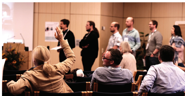
Wer hat Lust auf welche Session? Aus Ideenpräsentation und Interessensbekundung entsteht das Programm